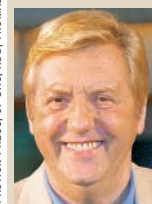
KARL MOIK, 66 Musikantenstadl