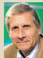
ULRICH WICKERT, 61 ARD-Tages-themen