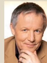
JÜRGEN FLIEGE, 57 Nachmittags-Talkshow