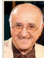
ALFRED BIOLEK, 70 Alfredissimo