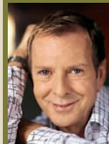
KURT AESCHBACHER, 56 Talkshow