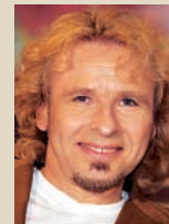
THOMAS GOTTSCHALK, 54 Wetten, dass ...?