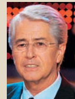
FRANK ELSTNER, 62 Menschen der Woche