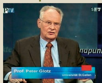
Prof. Peter Glotz Universität St.Gallen «Es gibt sehr guten Boulevard und schlechtes Feuilleton. Und umgekehrt.»