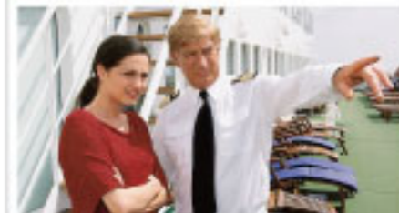
Sicherer Wert: Herzscherer auf hoher See