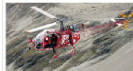
Die fliegenden Retter schwingen obenaus