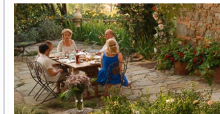
Ende eines Traums: Das Ferienhaus wird verkauft