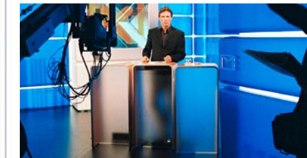
Kassensturz: Vierte Woche in Folge auf Platz 1